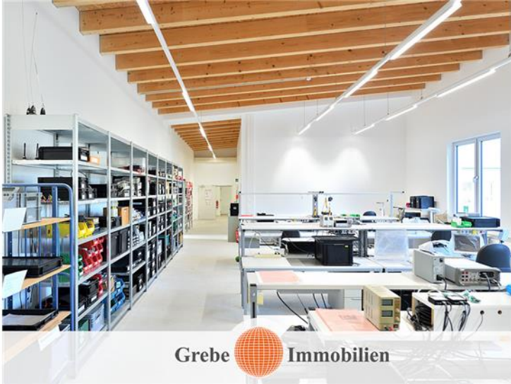
Produktionsbereich Bild 4