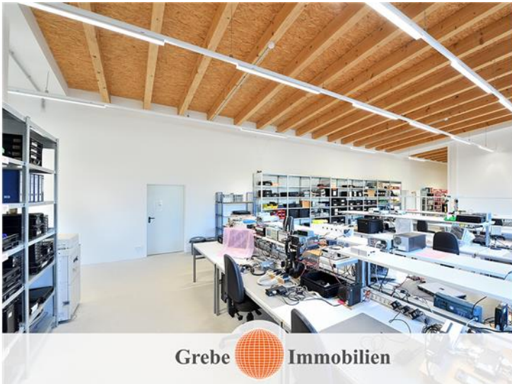
Produktionsbereich Bild 6