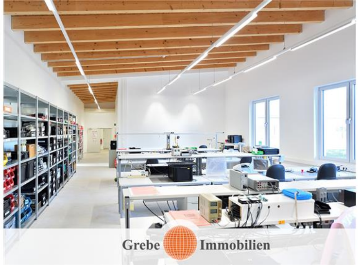
Produktionsbereich Bild 5