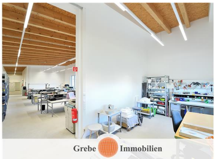
Warenannahme Bild 2