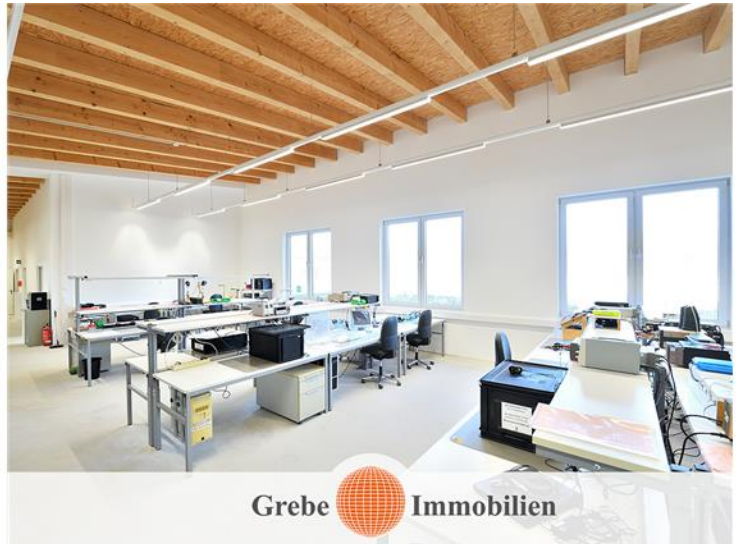
Produktionsbereich Bild 7